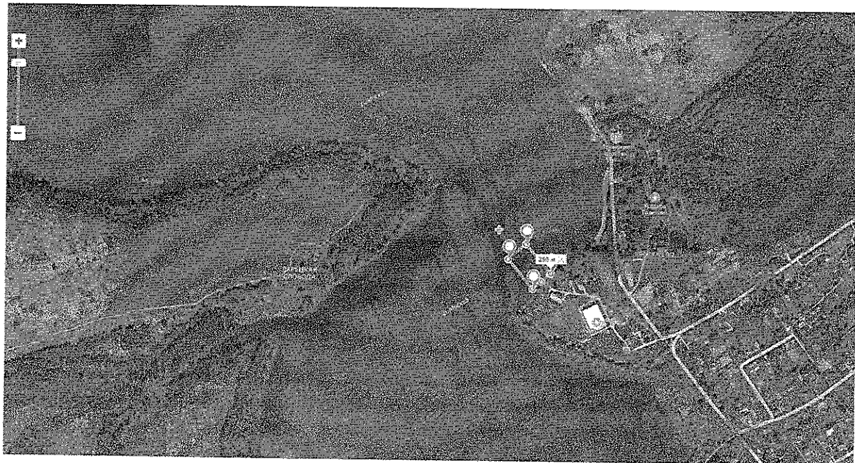
Рис. 2 – Общий вид рыбоводного участка